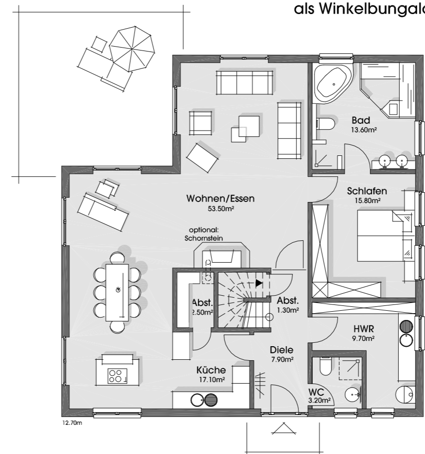
Erdgeschoss 1:125 124.60 m 2

Oder auch ohne das Dachgeschoss als Winkelbungalow schön :-)